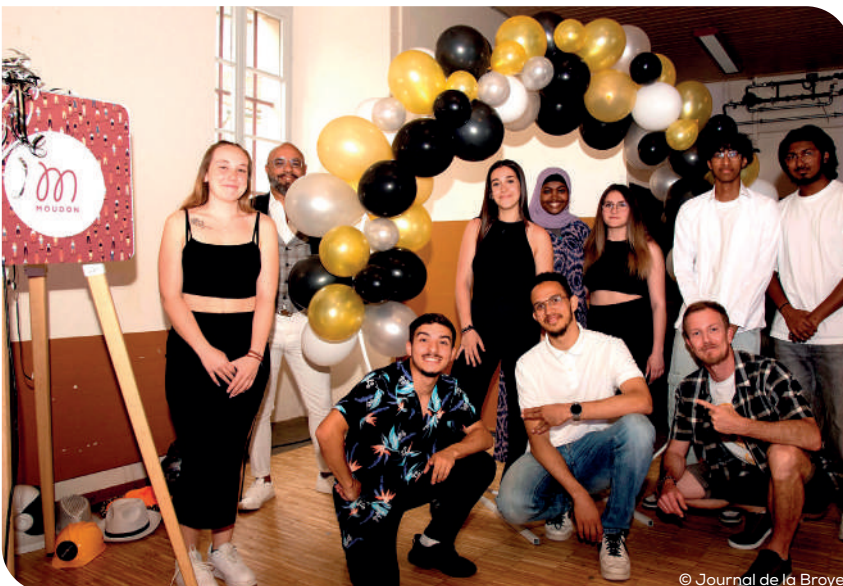
Réception des jeunes citoyens