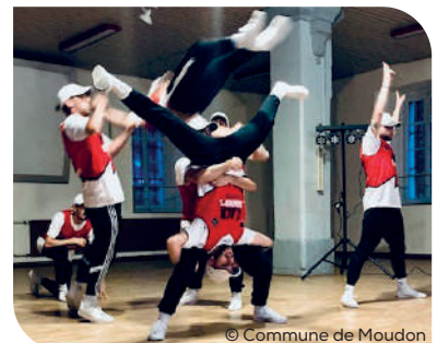
Les Black Diamond's en action