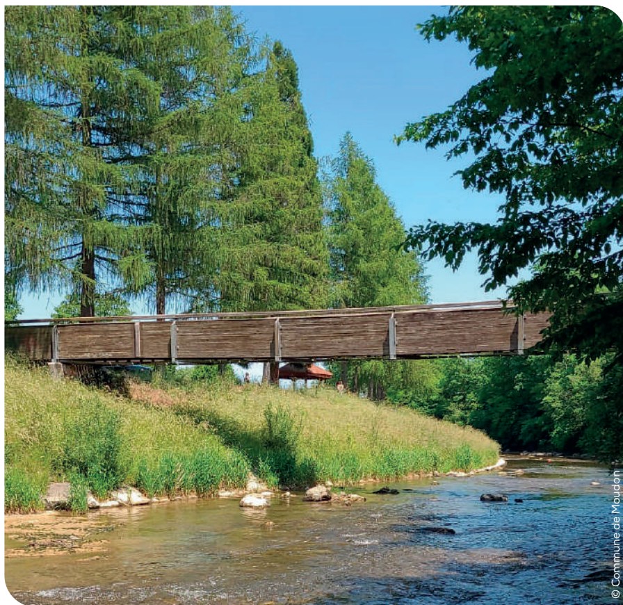
Remplacement de la passerelle des Ilettes

A la suite de l'octroi d'un crédit de Fr. 478'000.– par le Conseil communal le 2 mai dernier, les travaux pour le remplacement de la passerelle des Ilettes sont prévus du 17 juillet au 18 août 2023. Durant cette période,