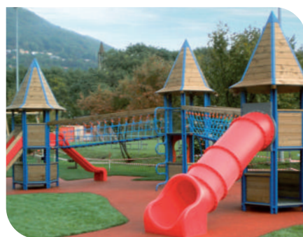
Illustration d'une combinaison de jeux «Ponte Capriasca» qui sera installée à Moudon (Fuchs Thun AG)

Pour rappel, la fermeture de la place de jeux Robinson s'est imposée depuis le 26 octobre 2022 car les anciennes installations présentaient un danger pour les enfants. Conformément à son programme de législation 2021-2026, la Municipalité a pour objectif d'offrir des infrastructures publiques adéquates. C'est dans ce cadre, qu'il est également étudié la réfection de la place de jeux des Terreaux.